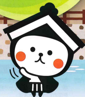
栃木市マスコットキャラクター とち介